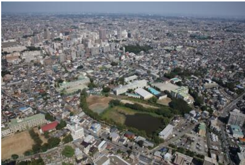
航空写真～アーバン&カントリーな浦商～