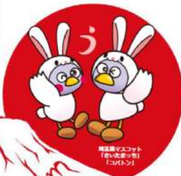
埼玉県マスコット 「さいたまっぴー」 「コバトン」